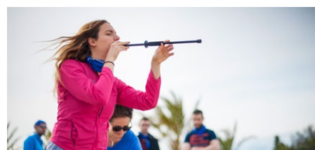
TIR À LA SARBAGANE