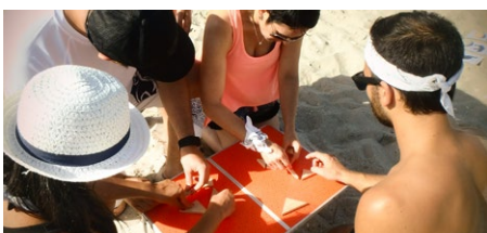
CASSE-TÊTES & ÉNIGMES