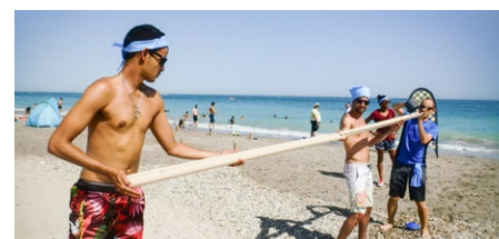
DÉFI PIPE LINE